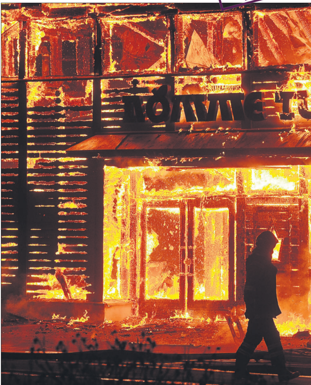
Mullu oli Lääne-Virumaal tunamullusega võrreldes vähem tulekahjusid.

Põlengu tekkepõhjus on selgitamisel. (VT)